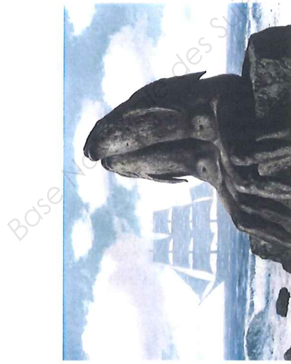
Document A - René Magritte-peintre surréaliste « Le Chant d'Amour » 77,5 x 98 cm collection privée