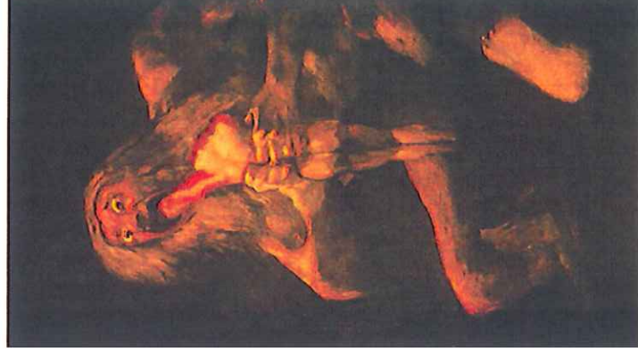
Document B - Francisco Goya « Saturne dévorant ses enfants » 146 x 83 cm Musée du Prado à Madrid