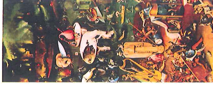
Document C Jérôme Bosch « L'enfer Musical » Tryptique du Jardin des délices panneau de droite

2- Classez par ordre chronologique (du plus ancien au plus récent) ces trois oeuvres .